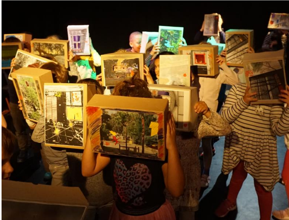
„Ich zeige Euch meinen Ort“